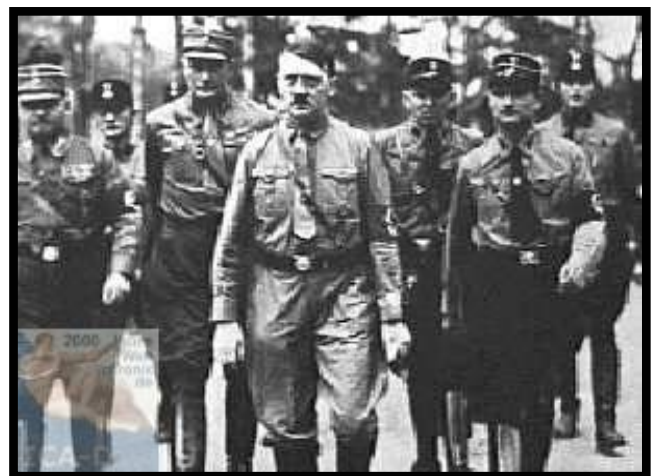
El Führer junto a Hess saliendo de una reunión en Berlín