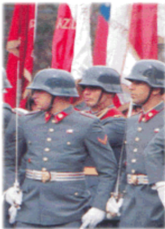
Nuestro Ejército: Ejemplo de valentía y patriotismo

Amigos míos, hoy en día en Chile la gente se autodenomina patriota defendiendo los mismos valores que se defienden en EEUU, tales como la libertad de expresión, de imprenta, y otras más; pero esas ideas no son propias del nacimiento de nuestra república.