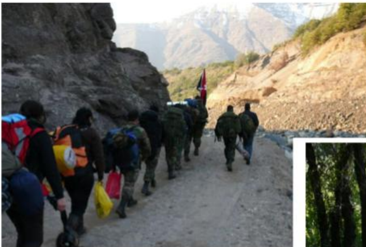
Espacios para explorar la naturaleza y conocer la belleza del territorio nacional en el campamento de invierno.