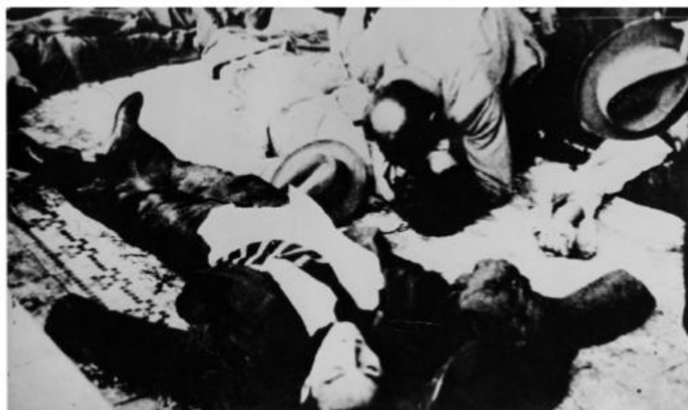
Nacistas asesinados bajo la orden del masón Alessandri.