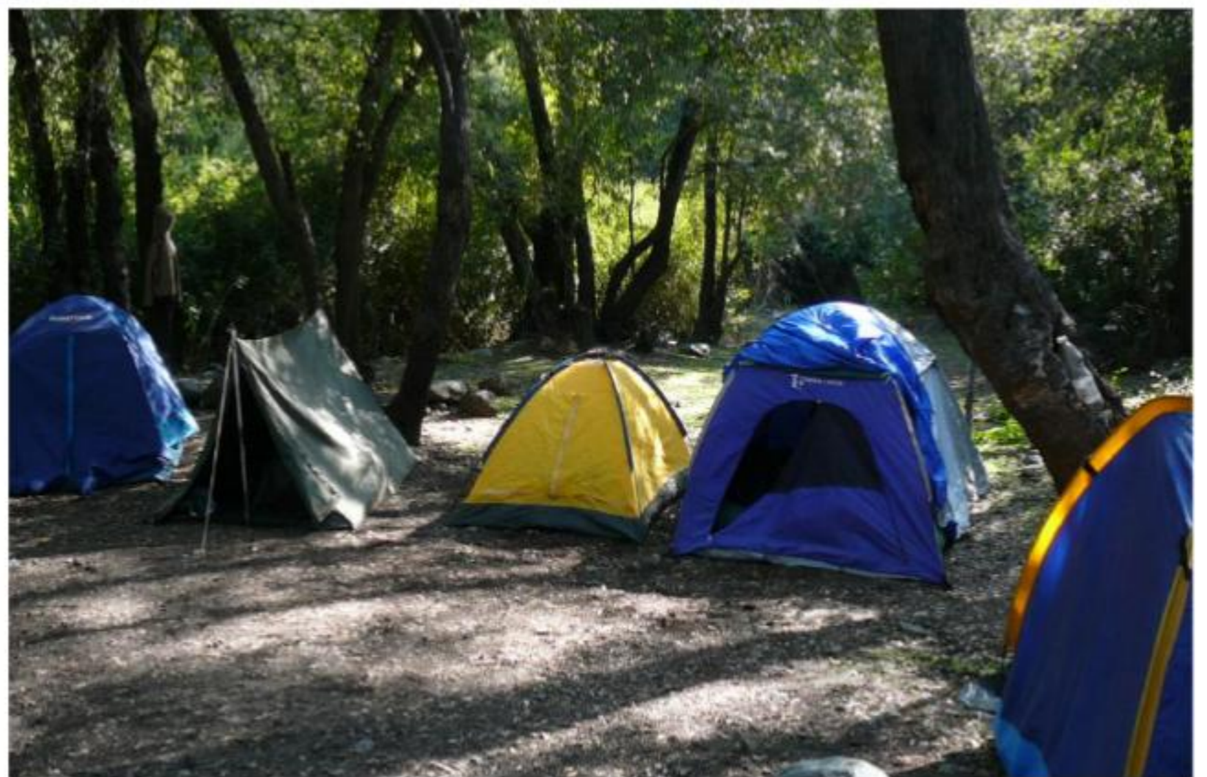
Momentos para la sana camaradería, en donde se comparte y se establecen lazos.