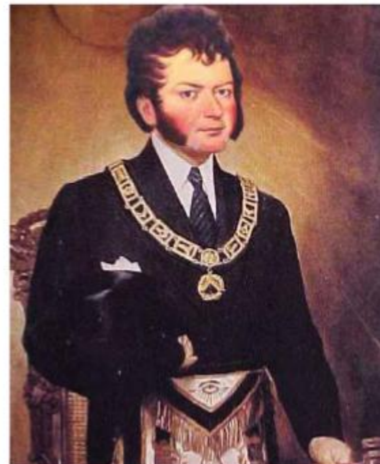
Bernardo O Higgins fue un conocido masón. Perteneció a la logia Lautarina junto a personajes emblemáticos de las independencias americanas, entre ellos; San Martín y Simón Bolívar.