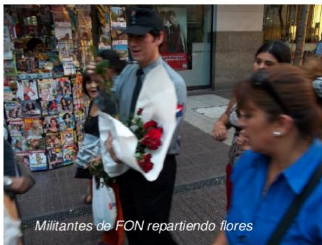
Militantes de FON repartiendo flores