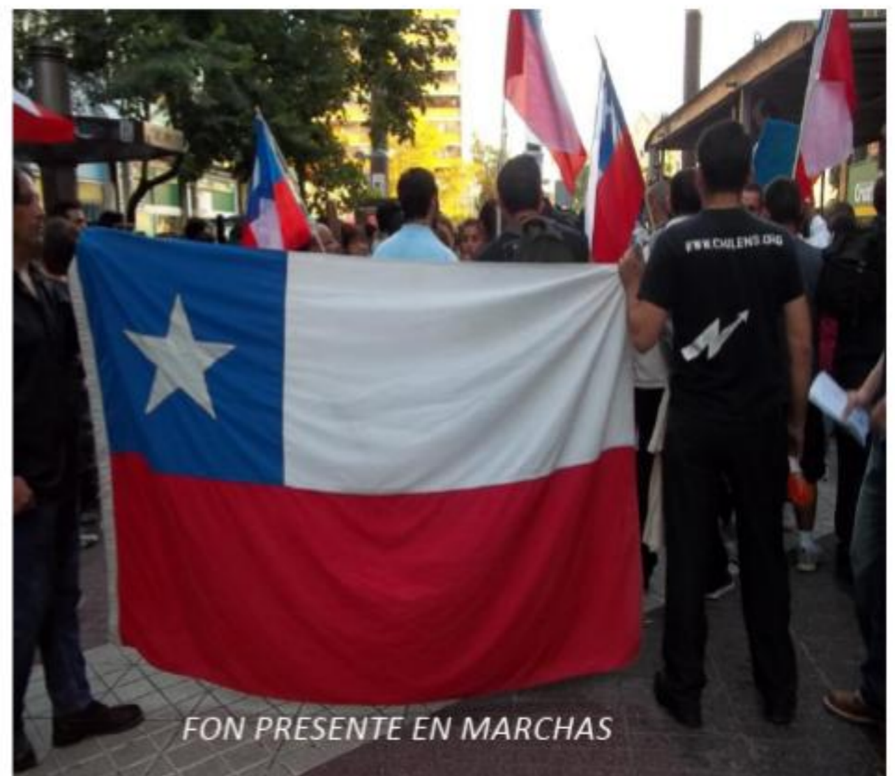
FON PRESENTE EN MARCHAS

En este sentido el deber de todo ciudadano es informarse al respecto para poder opinar y hacer sentir dicha opinión a los políticos que no representen el verdadero sentir del pueblo chileno, y que no se preocupen del bienestar de Chile y su gente. El Gobierno a su vez debe ser claro en cuanto a sus acciones y definir su actuar, si será este a favor del poder económico, en beneficio del bienestar tanto material como espiritual de la nación.