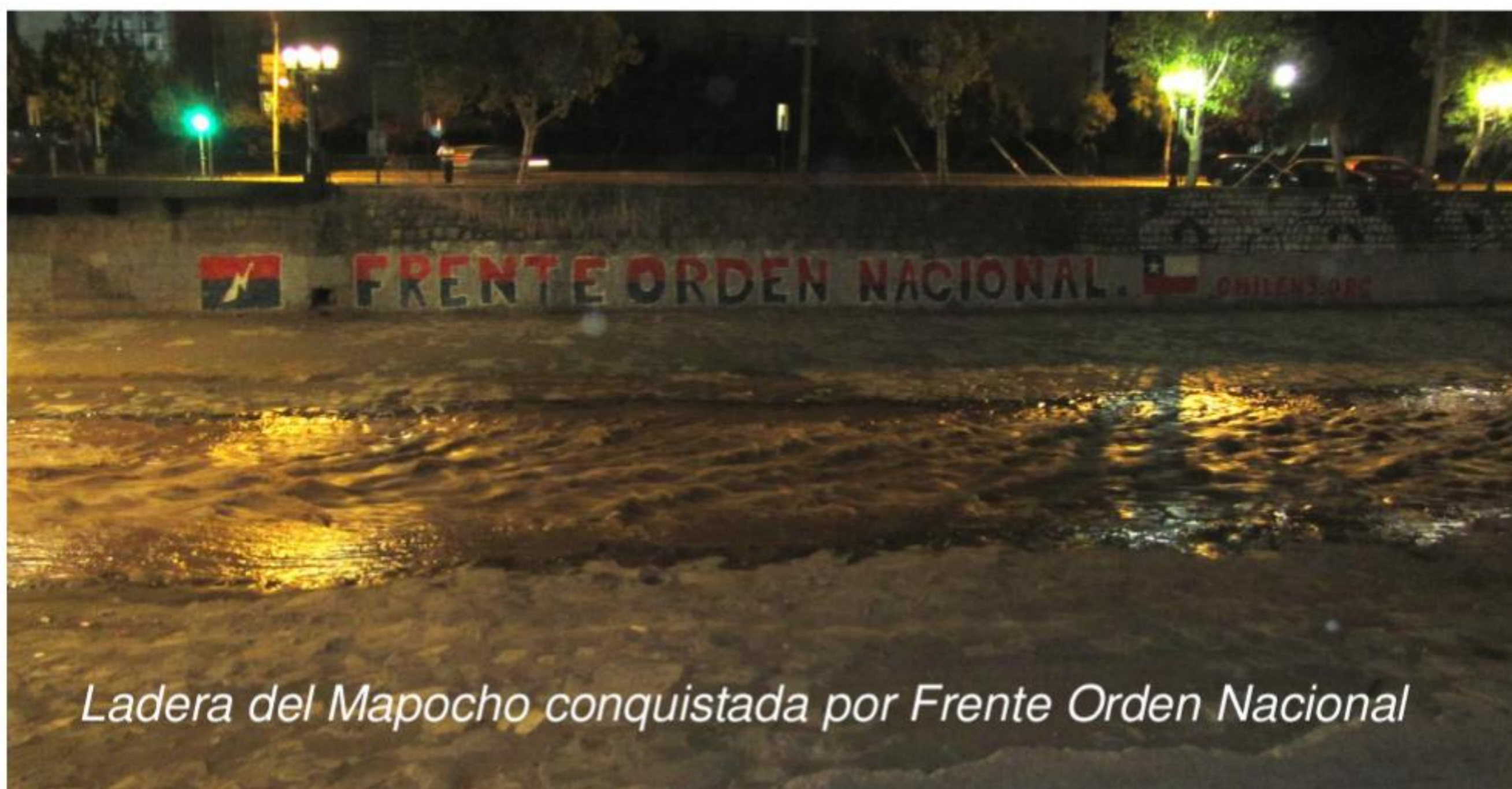
Ladera del Mapocho conquistada por Frente Orden Nacional

Chileno colabora y se parte del engranaje que moverá nuestra nación a lo que fue en la antigüedad, la Nación Guía de nuestra Latinoamérica.